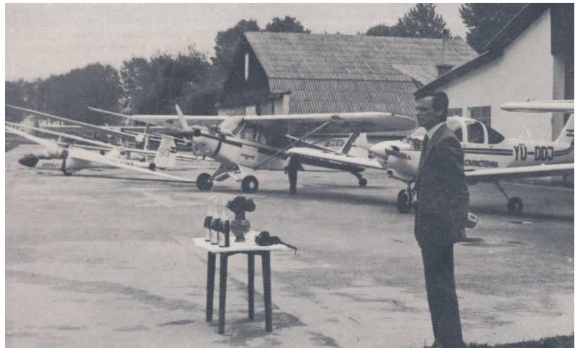
Krst najnovejših pridobitev: Cessne, Tomahawka, Super Cuba in Cirrusa

Za dosego naših ciljev bo aktivnost kluba usmerjena tudi v posodabljanje opreme in naprav. Zaradi nekaterih perečih problemov smo malo spremenili vrstni red vlaganja dela in sredstev v opremljanje in razširitev mehanične delavnice za letalski servis (samo za mala letala Piper),