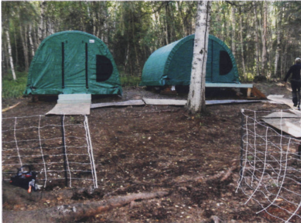
Tabor sredi divjine je zaščiten z ograjo z električno napetostjo.