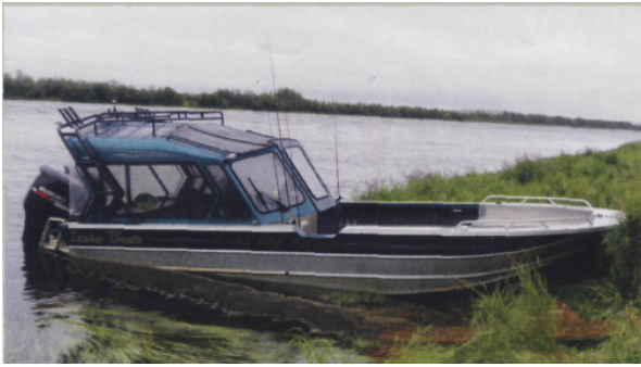
Prostora in hiter čoln s plitvim ugrezom in ravnim dnom, prilagojen za razmere ribolova ščuk