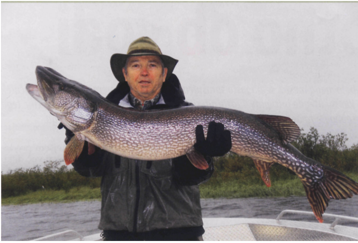
Moja največja, 127 cm dolga ščuka

Voda je sicer narasla za kakšnih tridesetih centimetrov zaradi dežja prejšnji teden v gornjem porečju Innoka, zato smo lovili še dlje od glavnega toka, v rokavih in na plitvinah jezer, poraslih s travo, kamor so se ribe pomaknile iz hladnejših predelov. Pravi užitek je bilo videti vodni val, ki ga naredi velika ščuka v 20 do 30 cm globoki vodi, ko se kot torpedo zapodi za blestivko. Najbolj bojevite so bile ščuke, velikosti 80 do 100 cm. Z njimi je bil ribolov res užitek. Katera od njih se je v boju kar sama rešila nadležnega brez zalustnika. Tiste večje pa so stavile bolj na svojo velikost in težo ter so se po navadi prej predale, kot bi vedele, da ne bodo končale na krovu čolna. V tistih dneh sem dolžine ujetih ščuk povečal: najprej na 122 cm in nato potrdil še z dvema ribama dolžine 124 cm.